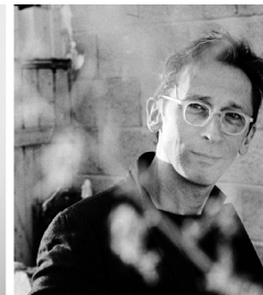
© Laurent Poléo Garnier et Samuel Berthet