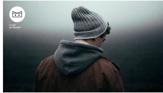
À voir en famille !

MAR. 12 ET MER. 13 MARS À 20H30 PETITE SALLE | DURÉE 1H15