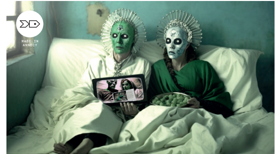
© Annabelle Chambon, Cédric Charron, Gwladys Gurlier & Midsjourney

JEU. 2 | VEN. 3 | SAM. 4 MAI À 20H30 | SAUF JEU. À 19H GRANDE SALLE | DURÉE ENV. 2H15