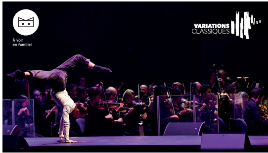
Karavel 15 © Gïlles Aguilier 2021